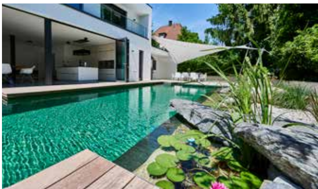
Naturpool von TeichMeister Kolhöfer GaLaBau aus München