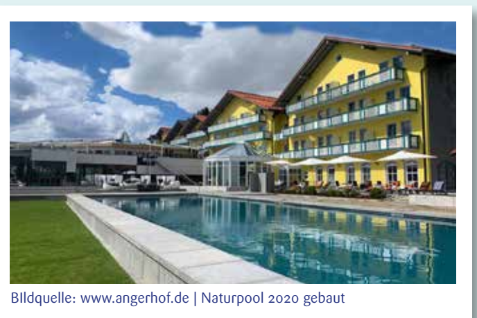
Naturpool 2020 gebaut