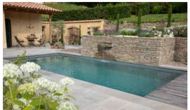
Naturpool im mediterranen Look von Eble Bauunternehmen aus Kinzigtal

SYSTEM + KOMPONENTEN Lieferant für biologische Filtersysteme BALENA GmbH | Teich- & Pooltechnik | www.balena-gmbh.de