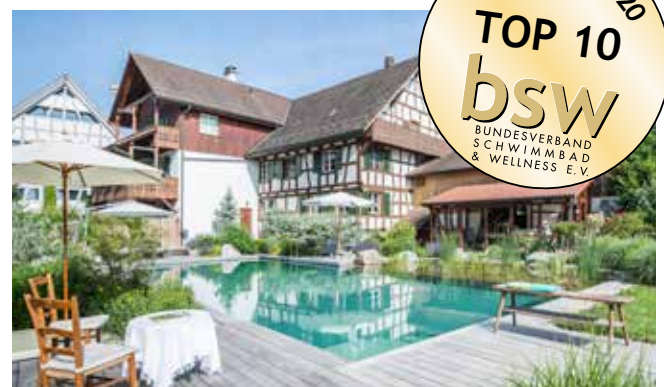
„GRIMM Gärten“ Frauenfeld in der Schweiz baute diesen Naturpool

Zum Verständnis: so funktioniert das Filtersystem „TeichMeister“. Die drei beim „bsw-Award 2020“ platzierten Naturpoolanlagen basieren auf diesem Prinzip.