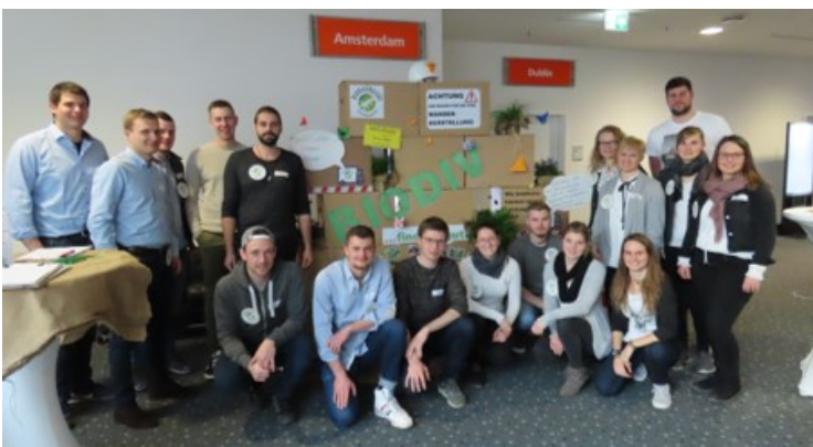
Die Technikerklasse der Meister- und Technikerschule Veitshöchheim präsentierte auf der VGL Bayern-Mitgliederversammlung 2020 die ersten Ideen für eine Wanderausstellung zum Thema Biodiversität.

Im Januar 2020 startete das Projekt „Wanderausstellung Biodiversität“ der Technikerklasse an der Meister- und Technikerschule Veitshöchheim. Der VGL Bayern begleitet seitdem die Arbeit der Studierenden in diesem Projekt. Am Rande unserer Mitgliederversammlung, am 12.03.2020, wurde eine Befragung durch die Studierenden durchgeführt. Die Auswertung dieser Befragung liegt nun vor ( Anlage 1 ). So schätzen 95 % der Befragten das Thema Biodiversität als sehr wichtig oder wichtig ein. 55 % würden die Wanderausstellung selbst einsetzen, 32 % eventuell. 100 % sehen im Thema Biodiversität für ihren eigenen Betrieb durchaus ein Geschäftsfeld, dabei haben 68 % der Befragungsteilnehmer in ihrem Unternehmen bereits Maßnahmen zur Steigerung der Biodiversität ergriffen bzw. geplant.