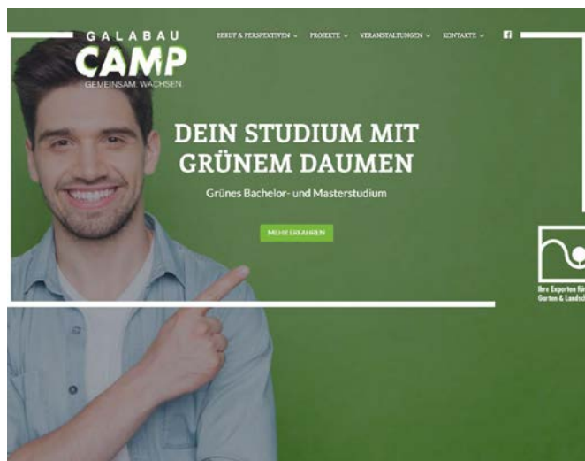
Mit der neuen Webseite präsentiert der BGL ein digitales Karriereportal für junge Landschaftsgärtner/-innen.