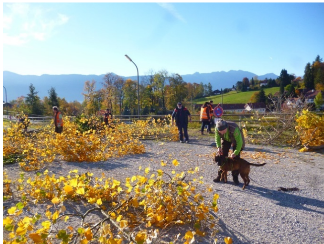
Lfl-Experten zusammen mit den ALB-Spürhunden bei der Bekämpfung des ALB in Murnau.

Die Quarantänezonen konnten zum 01.01.2021 aufgehoben werden. Die verantwortlichen Behörden, Kommunen und Firmen haben in enger Kooperation mit den Bürgerinnen und Bürgern die Maßnahmen des EU-Durchführungsbeschlusses 2015/893 konsequent umgesetzt. Dieses entschlossene Handeln hat eine Aufhebung nach nur vier Jahren Quarantänedauer ermöglicht. > mehr