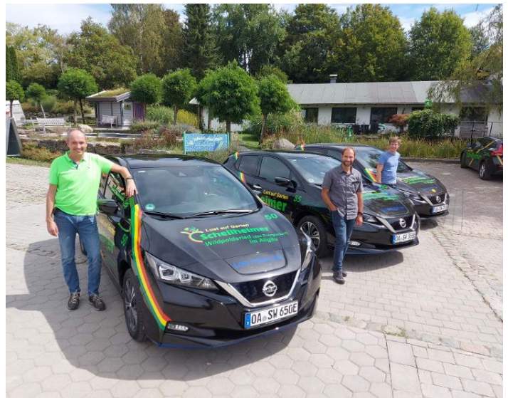
Seit Sommer 2020 ist das Schellheimer GaLaBau-Team mit Elektroautos unterwegs.

„Zugegeben, erst war ich etwas skeptisch“, erzählt der GaLaBau-Techniker. „Reichweitenangst und die Frage, bleibe ich irgendwo mit leerer Batterie stehen? Ich glaube, davon kann sich am Anfang niemand ganz frei machen.“ Dass er sich jedoch viel zu viele Gedanken um das Fahren mit einem Elektroauto machte, sei ihm schnell klar geworden. > mehr